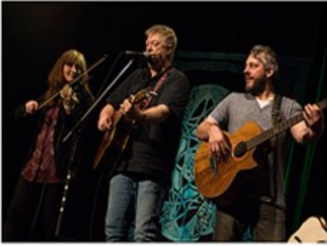
Paddy Goes To Holyhead