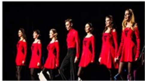
The Shannon Dancers